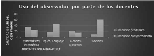
Gráfico 1: Uso del observador por parte de los docentes. (elaboración propia)

centes, no trabajar en clase, no llevar los materiales solicitados, no alcanzar los logros de la clase y hacer trampa o fraude en los exámenes. Encontrando que: