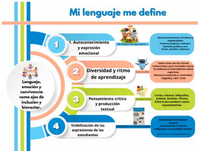
Figura 1. Ejes pedagógicos del proyecto Mi lenguaje me define.

El proyecto se planteó a través de la ruta cualitativa y participativa, sustentado en los modelos de Enseñanza para la Comprensión (EpC) y Aprendizaje Basado en Problemas (ABP). Su diseño integró cinco fases pedagógicas coherentes con los objetivos específicos, orientadas al desarrollo de competencias comunicativas, emocionales y sociales.