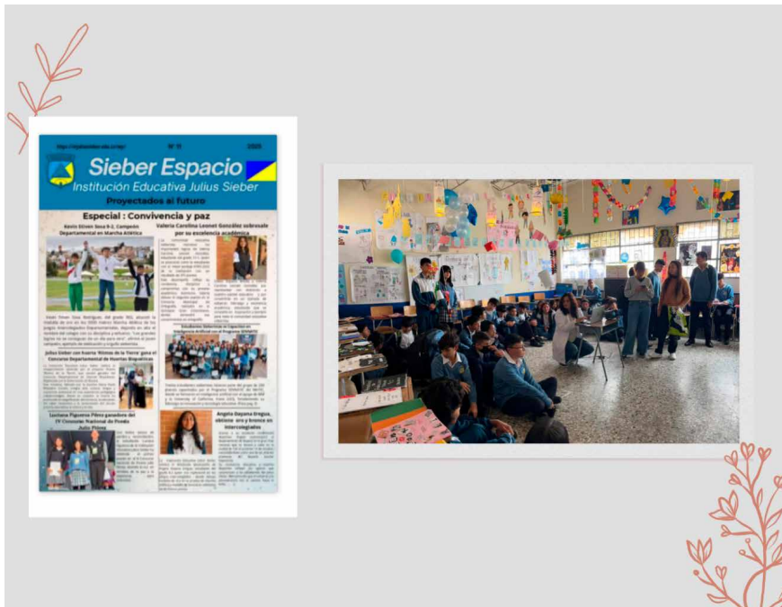
Fotografías de elaboración propia, 2025.